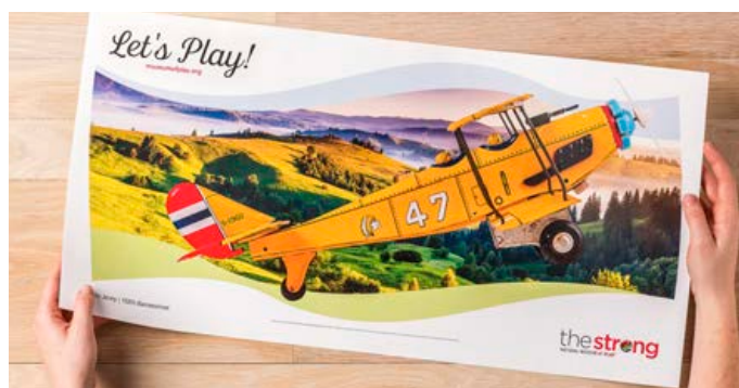
Drucken auf überlangen Papierformaten bis 330 x 660 mm

All das zusammen bedeutet: Höhere Margen, höhere Gewinne und das Potenzial für strategisches Wachstum mit einer einzigen, zukunftssicheren Investition.